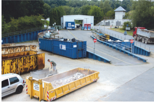
Recyclinghof der Entsorgungsanlage Hattorf am Harz

len auf den Recyclinghöfen des Landkreises reibungslos und vor allem ohne Blessuren abläuft, sollte man bei der Anlieferung auch auf die Sicherheit achten.