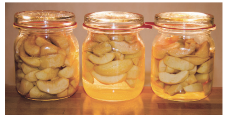
Urgroßmutter konnte die Haltbarkeit besser einschätzen. Einmachgläser im dunklen Keller waren die idealen Konservierungsbehälter. Man konnte die Lebensmittel auf verdächtige Verfärbungen und Schimmelbildung kontrollieren.

Fazit: Puddingpulver hält sich auch noch jahrelang bei trockener Lagerung, die Qualität leidet allerdings ein wenig. Also genießbar, wenn auch kein Hochgenuss für Gourmets.