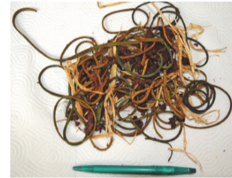
Gummibänder aus Gewölle eines Storches.