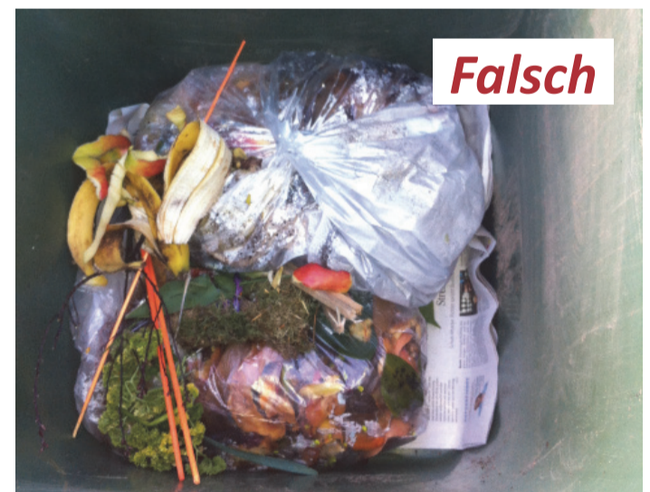
Blick in die Komposttonnen: Plastiktüten haben hier nichts zu suchen, weder als „Transportverpackung“ von der Küche bis zur Tonne, noch als „Verkleidung“ für die grüne Tonne. Sie verunreinigen den Kompost und zerfallen allenfalls zu problematischem Mikroplastik.

Komposttonnen, die nicht geleert wurden, enthalten entweder Restabfall oder der Bioabfall war in Plastiktüten verpackt. Beides lässt sich