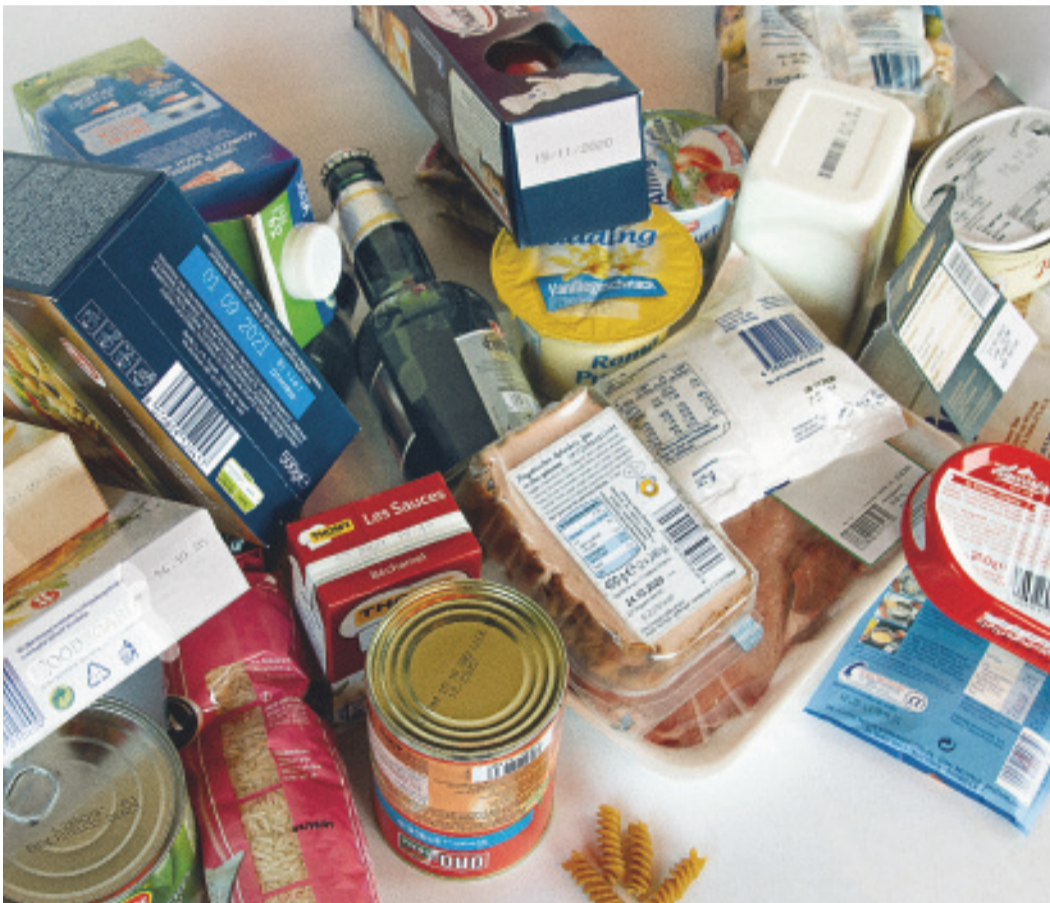
Auf vielen Lebensmittelverpackungen steht ein „Mindesthaltbarkeitsdatum“. Das ist nicht mehr als ein Anhaltspunkt. Unter ungünstigen Bedingungen können die Waren – wie etwa Brot – auch schon vorher etwa durch Schimmel unbrauchbar werden. Meistens sind sie aber deutlich länger haltbar.

Oma legte ein älteres Ei einfach in kaltes Wasser. Sank es ein, war es noch gut, stieg es