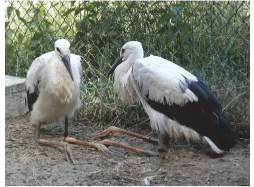
Zwei Jungstörche im Frühjahr im NABU-Artenschutzzentrum Leiferde

lich auch andere Vögel – zu schützen, sollten Gummibänder nicht mit dem Kompost entsorgt werden, sondern als Normalmüll über den grauen Restabfallbehälter. Vor allem bei Gemüse oder Schnittblumen, die mit Gummibändern gebündelt werden, sollte man auf die getrennte Entsorgung achten. Passiert das nicht, können dies Störchen – aber auch andere Tiere – das Leben kosten, so der NABU.