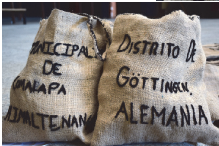
Jutesäcke, von Schülerinnen und Schülern in Guatemala hergestellt und bestickt, weisen auf die Partnerschaft zum Landkreis Göttingen hin.

diesem Wege sollten die Taschen einen Aufruf verbreiten, die schlimmer werdende Belastung der Umwelt durch Abfälle zu bekämpfen. Diese Botschaft wurde mit etwa 300 Taschen an die Stadtverwaltung und -politik übergeben und in Informationsveranstaltungen auch an engagierte gesellschaftliche Gruppen verteilt. Aus diesem Projekt entstand ein Runder Tisch Abfallwirtschaft, der sich der Verbesserung des örtlichen Umgangs mit Abfällen verschrieben hat. Der Landkreis Göttingen bringt sich beratend ein. Wegen der Pandemie findet der Kontakt derzeit in Videokonferenzen statt.