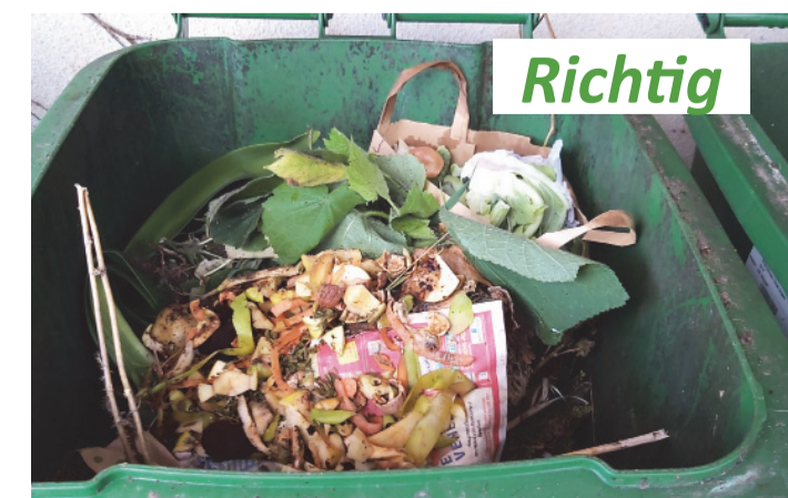
So ist es richtig! Die Komposttonne ist mit verrottbaren Abfällen gefüllt. Die alte Zeitung und die Papiertüte sind nicht störend, da sie mit den pflanzlichen Abfällen zu Kompost zerfallen.

Komposttonnen, die nicht richtig befüllt sind und demzufolge nicht mehr geleert werden, erhalten einen orangefarbenen Anhänger. Dem Nutzer einer solchen Komposttonne bleibt nichts anderes übrig als den Inhalt der Komposttonne nachzusortieren oder eine kostenpflichtige Leerung mit dem Restabfall zu beantragen.