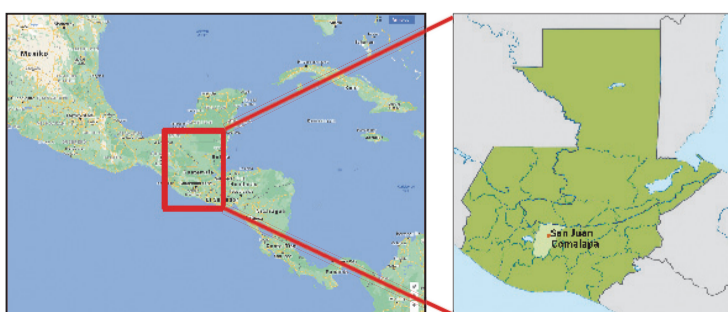
Die Stadt San Juan Comalapa liegt im mittelamerikanischen Guatemala

Bis zu fünf Elektro-Kleingeräte können auch im Rahmen der regelmäßigen Schadstoffsammlung der Abfallwirtschaft abgegeben werden. Sperrmüll wird auf Abruf abgeholt; der entsprechende Antrag ist auf der Webseite des Landkreises komfortabel zu stellen.