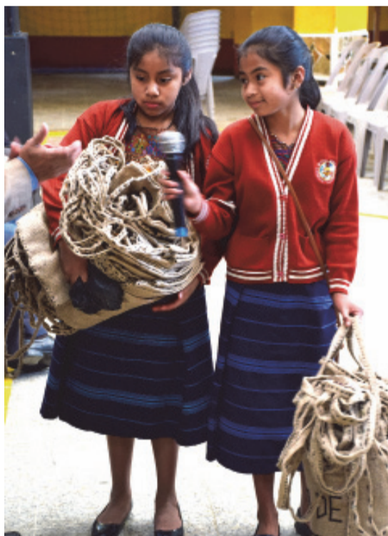
Offizielle Übergabe der Jutebeutel an die Stadtverwaltung

das nicht nur auf dem Papier. Um der auch in Comalapa sehr hohen Abfallbelastung etwas entgegenzusetzen, wurden Jutetaschen als Alternative zu vorherrschenden Plastiktüten hergestellt für den eigenen Gebrauch, aber auch zur Weitergabe. Auf